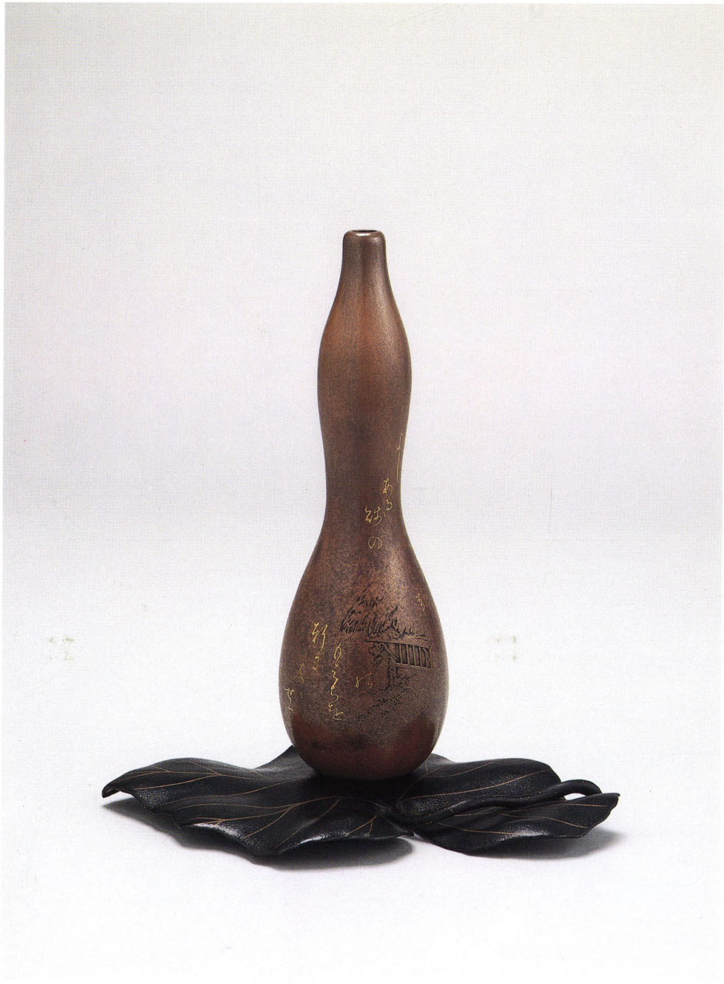
16 海野勝珉・鈴木光之 〈素銅蕙紅葉瓢形花瓶〉 明治33年(1900)